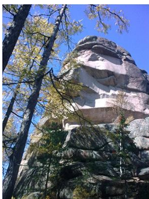
Скала "Дед", Заповедник "Столбы", Восточные Саяны.

Особенный интерес представляет эстетическое восприятие форм геологических объектов, а также изучение их типов и видов.