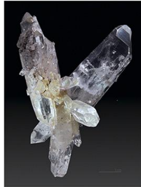
Горный хрусталь.

Читая биографии многих прославленных художников, мы обычно не обращаем внимание, а удерживаем где-то в подсознании очень странную и невероятно простую вещь: своё вдохновение мастера чаще всего черпают в природе, живой природе, нежели в чужом искусстве; второе чаще востребовано в период изучения основ техники и классических художественных сюжетов. Порой кажется, что в большей степени преуспевают в оригинальности те художники, которые чаще работают на пленерах, художники, которые подсматривают у природы, а не в мастерских именитых живописцев. Поэтому, мы в праве предположить, что чрезмерное воздействие искусства на молодого художника приводит к искусственности и его собственного творчества. Существует также наблюдение, что и природа способна подражать искусству. Однажды во время прогулки мой отец посмотрел на небо и сказал «прямо акварель» и добавил «будто сама природа черпает у художников». Занимательно, что примерно год назад на том же самом месте один из моих знакомых, взглянув на облака, воскликнул «словно нарисованные».