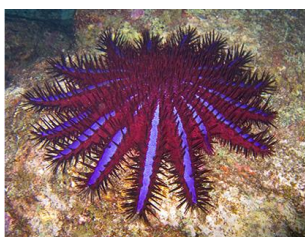
Морская звезда, Индийский океан.

Причудливые переходы в формах окаменелых и живых морских животных и растений: кораллов, раковин моллюсков, морских звёзд, водорослей — создают у наблюдателя ощущение, будто сама природа экспериментирует с художественными техниками, цветами и линиями, их сочетаниями.