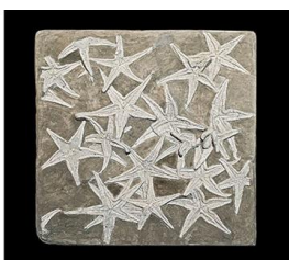
Вымершие виды морских звёзд, юрский период