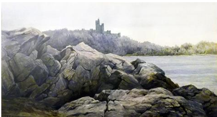
Уильям Дэлглайш. Пейзаж с замком. Акварель. 1877 (из частного собрания)

Занимательно проследить возникающие ассоциации с теми или иными предметами и их связи с произведениями искусства, созданными рукой человека. Для внимания исследователя важное значение имеет и влияние произведений природы на наше сознание. Можно попробовать провести параллели, например, по способу воздействия на нас различных минералов с искусством созданным людьми — профессиональными и непрофессиональными художниками. Вероятнее всего, сравнение имеет смысл проводить с живописью, как наиболее разнообразному по своим жанрам виду искусства.