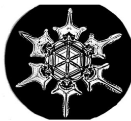
Снежинки. Фото: Уилсон Бентли