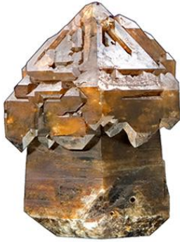
Кварц. Россия, Алтай.

для цветовых сочетаний. Среди творений природы нам встречаются и предметы с одним цветом, и со множеством цветовых переходов. Жёсткая геометрия выражена в основном кристаллами разных твердых пород.