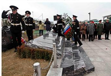
Возложение венков и передача земли с Родины к могилам моряков

В ознаменование 100-летия исторического морского сражения в порту Инчхон в 2004 г. открыт мемориал крейсера «Варяг» и канонерской лодке «Кореец»: мемориальная доска и памятник, посвящённые крейсера «Варяг». Мемориальная доска установлена на здании бывшего госпиталя Красного Креста, где проходили лечение моряки, получившие ранения в ходе боя. При открытии памятника была проведена церемония с участием корейских и российских военных. Последние прибыли в порт на кораблях отряда Тихоокеанского флота. После официальной части судна ТОФ приняли участие в российско-корейских военно-морских учениях.