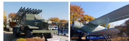
Советская боевая машина реактивной артиллерии БМ-13 периода Великой Отечественной войны — легендарная «Катюша»