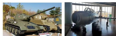
Советский танк Т-34

Президент и исполнительный директор компании Lotte Hotel Сон Ён Док уверен, что памятники российским и советским деятелям и военно-историческим событиям станут хорошим напоминанием о богатом культурном и духовном наследии России. Он также выразил надежду, что уже в ближайшем будущем в Корею будет приезжать больше российских туристов, чему будет способствовать вводимый между Россией и Республикой Корея с начала 2014 года безвизовый режим посещения.