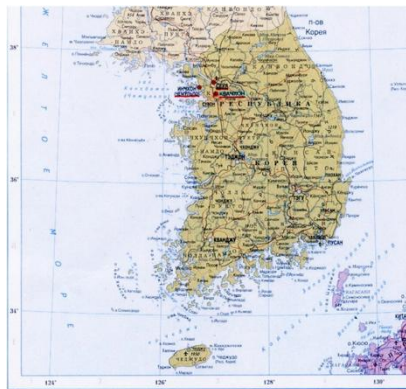
Республика Корея Красные цветом отмечены города, в которых имеются памятники советским и российским деятелям и военно-историческим событиям.

Соперничество США и СССР за влияние и авторитет в Корее проявилось в представительских автомобилях, подаренных лидерам Южной и Северной Кореи. Американский президент Дуайт Эйзенхауэр подарил в 1956 г. первому президенту Республики Корея Кадиллак Флитвуд 62. Советский вождь Иосиф Виссарионович Сталин подарил лидеру Северной Кореи лимузин ЗИС-110. Этот подарок оказался в Военном мемориале, вероятно, из-за Корейской войны, когда некоторое время Сеул был столицей Северной Кореи [10].