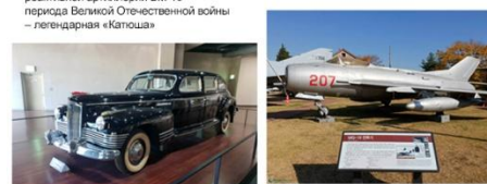
Советский автомобиль ЗИС-110