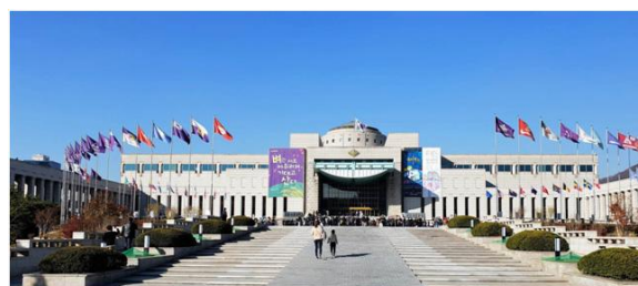
Национальный военный мемориал Республики Корея

СЕУЛ , столица. Национальный военный мемориал Республики Корея открыт в 1994 г. Он расположен в историческом центре Сеула. Здесь представлена военная история Кореи и особое внимание уделено военной технике Корейской войны 1950-1953 гг. В музее содержится более 13 тыс. экспонатов, представляющие образцы оружия разных эпох – от доисторического времени и до современного периода. В отдельном зале находится экспозиция, посвящённая войне между Северной и Южной Кореей.