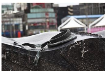
Мемориал крейсера «Варяг» и канонерской лодке «Кореец»

В 2003 г. состоялась первая российская экспедиция с погружением в район обломков, были подняты некоторые небольшие детали. В погружении принимал участие внук капитана «Варяга» В.Ф.Руднева, проживающий во Франции.