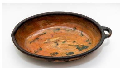
Илл. 12. Сковорода для запекания рыбы (жаровня). Деревня Василевской округи, Балахнинский уезд, Кон. XIX в. Из коллекции НГИИМЗ.