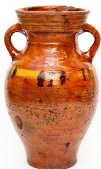
Илл. 5. Кувшин. Деревня Василевской округи. Балахнинский уезд. Кон. XIX – нач. XX в. Из коллекции НГИАМЗ.

Примыкает к этой группе еще один кувшин (ГОМ-19721/5). Его форма в основном повторяет форму квасника Л.Гандурина, но отличается цветовым решением: кувшин красно-коричневого оттенка, а на плечике – белая полоса с пятнами темно-коричневого цвета, сгруппированными по три и расположенными с промежутками (Илл. 5).