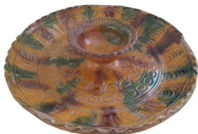
Илл. 3. Блюдо-блинница. Деревня Василевской округи. Балахнинский уезд. Кон. XIX – нач. XX в. Из коллекции НГИИМЗ.

У деревень василевской округи более разнообразный ассортимент изделий: кухонные и молочные горшки, рыбные жаровни, хлебные плоски, ведерки, сметанники, блюда, кастрюльки, дойники и подойницы, масленки, цветочные банки, банки для опары. Конечно, основной тип гончарной посуды Василевой Слободы и прилегающих деревень имел самый простой, незамысловатый вид. Эти горшки мастера делали сотнями, тысячами. В любом крестьянском доме, да и в городских усадьбах всегда была надобность в них. Для их создания мастера использовали самые простые приемы декора. Ровные, иногда ребристые линии наводились по мягкой сырой глине, волнистые пояски, напоминающие след змеи на песке. Встречается упоминание о том, что эта змейка воспринималась в крестьянском мире как некий оберег. Будто бы эта орнаментальная «змейка» оберегала зерно, хранящееся в глиняных горшках. И, выбирая посуду на базарах, хозяйки специально выискивали этих змеек на глиняных горшках и корчагах.