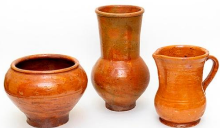
Илл. 8. Посуда, вырабатываемая Горьковским стеклосюзом. Промартель им. Якова Петрова. Мишнево. Городецкий район. Нач. 1930-х гг. (до 1934 г.) Из коллекции НГИИМЗ.