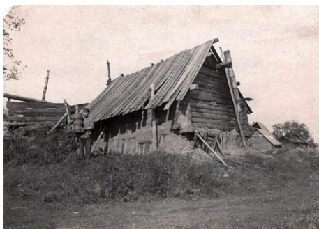
Илл. 1. Гончарное заведение в Василёвой слободе. 1900-е гг.

Что касается ассортимента изделий, то Василево специализировалось на чернолощеной крупной посуде: корчаги различных размеров, плоски, крышки и трубы. В собрании Нижегородского музея-заповедника находится фотография «Гончарное заведение в Василевой слободе» (Илл. 1), датируемая 1900-ми гг. (ГОМ-20309). На ней справа от мастерской стоит мужчина с тремя корчагами в руках. Они цилиндрической формы, с небольшим расширением в центре. Такую же форму корчаг мы видим на фотографии василевского гончарного завода, опубликованной в книге «Василевская сноровка» [10]. В музее