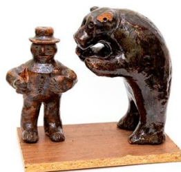
Илл. 7. Игрушка глиняная. Горянское. Балахнинский уезд. К. XIX – нач. XX в. Из коллекции НГИАМЗ. Фото С.Н.Дремина.

В деревне Горянское в наше время живут дачники, которые часто на своих огородах находят обломки керамики. Дачницы оформляют этой битой керамикой клумбы. Фрагменты удивительным образом сохранились, и для сотрудников музея стали ясны элементы декора, цвет поливы изделий конца XIX – начала XX вв.