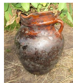
Илл. 6. Кувшин в д. Большое Рябино.

В экспедиции 2018 г. в деревне Большое Рябино удалось найти несколько предметов, имеющих те же характеристики. По всей видимости, горшок, в который в наши дни хозяйка высадила цветы, был бракованным, мы видим, как «смято» его горло (Илл. 6). Это могло произойти только на этапе сушки горшка и обжига. Интересно, что мастер не отложил этот предмет в сторону, а завершил свою работу. Вероятно, кувшины этих форм ценились, даже бракованные.