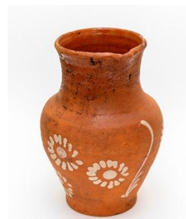
Илл. 9. Кринка. Чкаловский район. 1940-е гг. Из коллекции НГИИМЗ. Фото С.Н.Дремина.

не позже 1934 г. Здесь три предмета с поливой красно-коричневого оттенка и минимальным декором в виде рельефных полос: кувшин с невыраженным горлом, горшок и кринка с высоким горлом и относительно небольшим шаровидным туловом (Илл. 8). Еще одна кринка (ГОМ-27530/2) – экспедиционный сбор музея 2018 г. Она датируется 1940-ми гг. Форма близка к квасникам рубежа XIX–XX вв., но выполнена более грубо, без поливы и с орнаментом по тулову белого цвета в виде ромашек (Илл. 9).