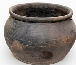
Илл. 2. Корчага-межеумок. Василево. Кон. XIX – нач. XX в. Из коллекции НГИИМЗ. Фото С.Н.Дремина

три таких корчаги. Никакой информации об их происхождении учетная документация не дает. Но, опираясь на фотографии, можно утверждать, что это работы мастеров Василева. Косвенно это доказывает и проведенное измерение предметов по системе, описанной автором XIX в., – по диагонали. В итоге получилось, согласно его классификации, что предмет с номером ГОМ 20847/11 – это маленькая корчага (7 вершков); ГОМ-24114 – корчага-межеумок (8 вершков) (Илл. 2), ГОМ-23789/4 – полумаленькая (6 вершков).