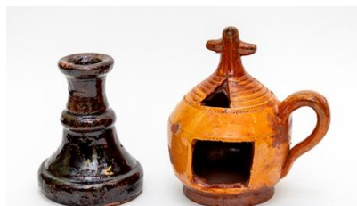
Илл. 11. Кацея и подсвечник. Деревни Василевской округи. Балахнинский уезд, Кон. XIX – нач. XX в. Из коллекции НГИИМЗ.