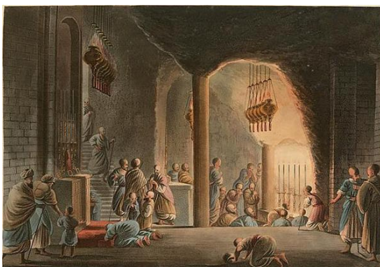
Храм в Вифлееме

Пещеры естественного и искусственного происхождения являются местом проведения сакральных церемоний и обрядов во многих мировых религиях. В данном случае, объектом изучения и анализа явились подземные сооружения на территории Российской Федерации, используемые с целью совершения богослужений православными христианами.