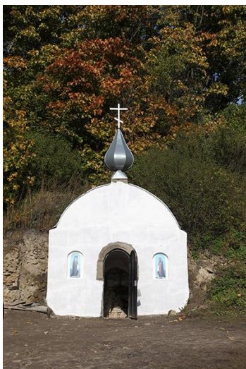
Вход в подземный монастырь

Пещерный храм во имя священномученика Игнатия Богоносца в скиту при Успенском Валуйском монастыре XVII века в Белгородской области был официально открыт и освящен уже в 1914 году. Общая длина коридоров подземного комплекса составила 640 метров, высота проходов до 3 метров и шириной до метра, храм 8 на 9 метров и 5,5 метров в высоту. Храм был razoren, возобновлен в 2007 году [16].