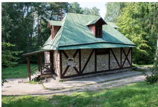
Усадьба «Поленово». Здание «Адмиралтейства»

постоянной основе действует зал для организации мероприятий – конференций, концертов, спектаклей, балов.