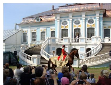
Государственный историко-культурный и природный музей-заповедник А.С.Грибоедова «Хмелита». Грибоедовский праздник

Для посетителей в музее проводится большое количество мероприятий, многие из них – на постоянной основе: выставки, в том числе виртуальные, лекции, экскурсии, конкурсы, предлагается литература и сувенирная продукция. В лектории выставочного павильона музея проходят интеллектуальные игры, мастер-классы. В течение года проводятся экскурсионно-туристические программы выходного дня, интерактивные программы, различные мастер-классы, корпоративные