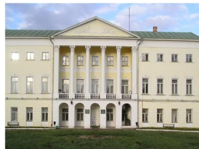
Усадьба «Ивановское». Главный фасад

Интересна деятельность Федерального музея профессионального образования, являющегося филиалом Московского политехнического университета в г.Подольске. Музей входит в Союз музеев России, является членом Ассоциации научно-технических музеев Российского отделения ИКОМ. В экспозиции представлены данные об истории профессионального образования России с Петровской эпохи до современности, также материалы, посвященные народным промыслам и историческая часть – сведения об истории усадьбы «Ивановское», о бывших владельцах усадьбы, деятелях российской истории – А. Закревском, меценатах Бахрушиных.