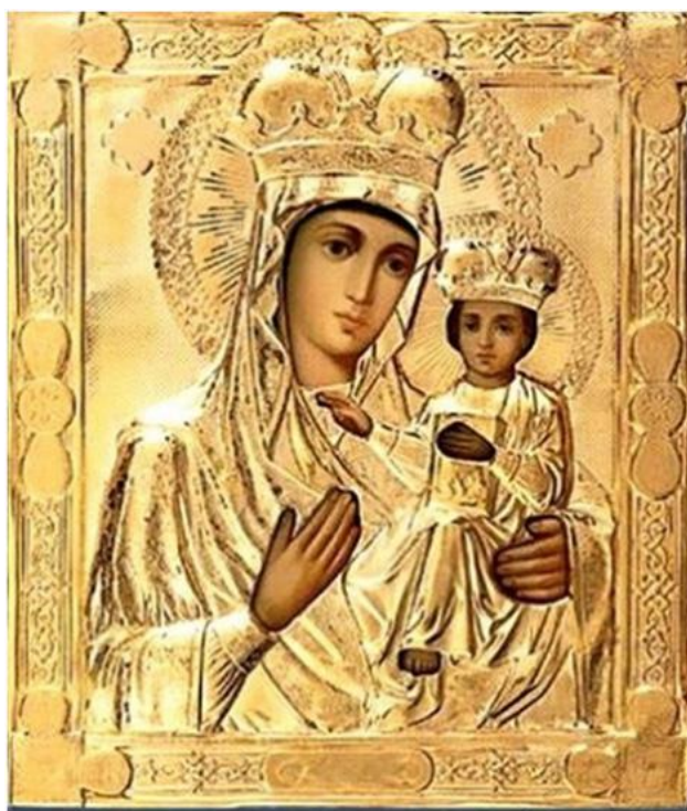
Озерянская икона Богоматери (список иконы)

Данные о времени появления иконы имеют существенные расхождения: С.В.Булгаков [9] и А.Ковалевский [10] относят ее к концу XVI в., Д.П.Миллер и Д.И.Багалеи – ко времени гетманства И.М.Брюховецкого 1668 г. [11]. П.Е.Михалицын [12] относит явление этой иконы к 1710 г., то есть к началу основания Озерянской Богородичной пустыни и монастыря в Озерянке, то есть того места, на котором была обретена икона. Источники значительно расходятся не только в отношении времени обретения, но и способа. Суть повествования о явлении иконы сводится к следующему: обрел ее некий малороссийский крестьянин, косивший траву и нечаянно расколовший её пополам. После усердных молитв доски чудесным образом склеились и икона вновь обрела целостность, а на месте ее явления забил целебный источник.