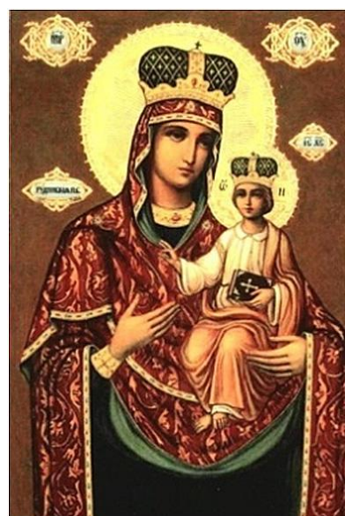
Рудненская (Руденская) икона Богоматери (список иконы)