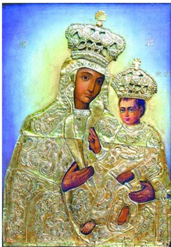
Крупецкая икона Богоматери (список иконы)