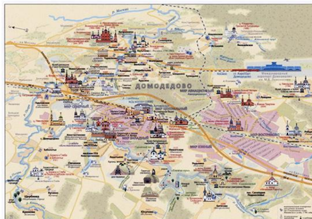
Центр города Домодедово

В настоящее время наш Центр картографии и геоинформационных систем разработал карту «Городской округ Домодедово. Культурное и природное наследие» (2022). Карта многокрасочная, имеет две стороны. Обратная сторона карты содержит справочную информацию о городском округе Домодедово, его достопримечательностях и о многом другом. Руководитель проекта: В. В. Аристархов. Ответственные редакторы: А. И. Ельчанинов; Г. А. Белухин. Авторы: А. И. Ельчанинов, Е. В. Боговик, В. Н. Ведешкин,