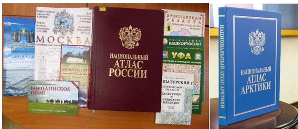
Избранные труды Центра картографии и геоинформационных систем

Раздел «Культура» занимает 280 из 496 страниц тома и состоит из четырёх подразделов: «Вводная часть», «Культурное и природное наследие», «Современная культура», «Справочные сведения».