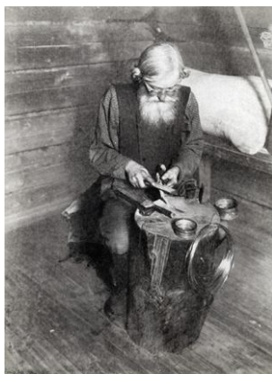
Крючкодел. Фото 1896 г.

Село Безводное Кстовского района Нижегородской области находится на правом берегу Волги и делится на две части – Верхнее Безводное и Нижнее Безводное. По некоторым косвенным данным время основания этого села относится к 1130 году [1]. Почвы села Безводное не являются плодородными, а наличие на территории этого населенного пункта нескольких оврагов создало такие метеорологические условия, благодаря которым в безводнинской округе выпадает