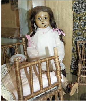
Кукла Мила на выставке «100 лет детского житья...» в «Усадьбе Рузавичиных»

Девочки принимались в Институт в возрасте 10-12 лет, обучение длилось 6 лет. Воспитанницам преподавались Закон Божий, история, география, русская словесность, арифметика, естествознание, физика, французский и немецкий языки, чистописание, рисование, музыка, пение, танцы, изящные и хозяйственные рукоделия. Именной список выпускниц и табель их оценок отсылался Императрице. В коллекции Сергеевых хранится Альбом Мариинского института на 1913 учебный год.