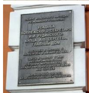
Главный дом Усадьбы И.И.Рудникова – А.П.Сергеева. Современный вид.

документу, он владел обширными участками леса в Вологодской, Костромской и Казанской губерниях. В 1897-1904 г. Сергеев состоял гласным Нижегородской городской Думы. В 1899 г. вместе с супругой получил звание потомственного почетного гражданина Нижнего Новгорода. С 1900 по 1917 г. Сергеевы жили в собственном доме на Большой Печерской улице. Этот дом дошел до наших дней (современный адрес – ул. Б.Печерская, д. 14), является объектом культурного наследия регионального значения [5].