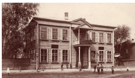
Сергеевское городское начальное училище. Н. Новгород. Нач. XX в.