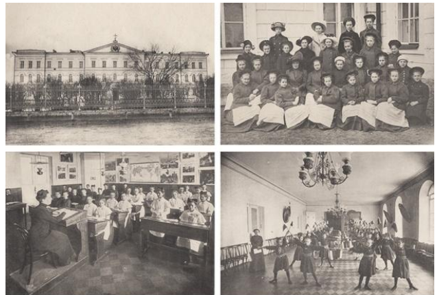
Нижегородский Мариинский институт благородных девиц. 1913 учебный год. Издание фирмы С.Случанский и Сын в Париже.

Мариинский институт являлся закрытым перворазрядным учебным заведением, преимущественно для дочерей потомственных дворян и военных чинов не ниже штаб-офицерского, а также для дочерей купечества 1-й и 2-й гильдии.