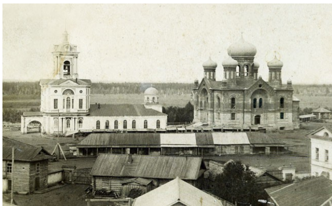
Глазов. Вознесенский храм-колокольня, Никольская церковь и Преображенский собор. 1890-е годы.