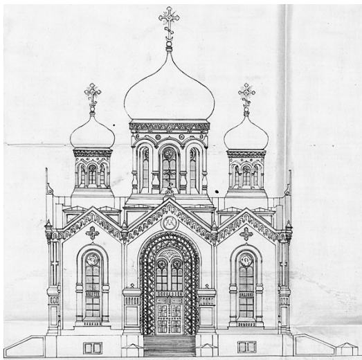
Проект нового Преобр. собора г. Глазова. 1877 г. РГИА. Ф.1293. Оп.114. Д.18. Л.14

«Собор с зарокотом» фактически представлял собой репортаж, живописную зарисовку с натуры, предназначенную для немедленной публикации в прессе. Поэтому, в отличие от других глазовских, чисто литературных, очерков Короленко, этот рассказ отличается высокой степенью достоверности и документальности.