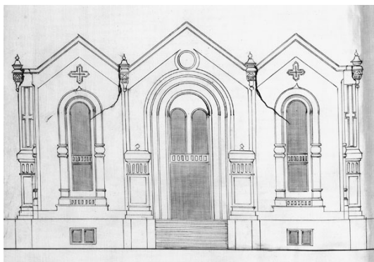
План руин Преображенского собора. 1879 г. РГИА. Ф.1293. Оп.114. Д.18. Л.5об.

На основе этих отдельных примеров можно с уверенностью утверждать: описанное Короленко в повести «Глушь» описание духовенства и храмов города Пустолесье имеет мало общего с реальным православным Глазовым. За исключением одного единственного эпизода – обрушения недостроенного здания нового городского собора, ставшего ярким смысловым центром всей повести. Эта катастрофа, в свою очередь, также стала темой и основным содержанием очерка «Собор с зарокон».