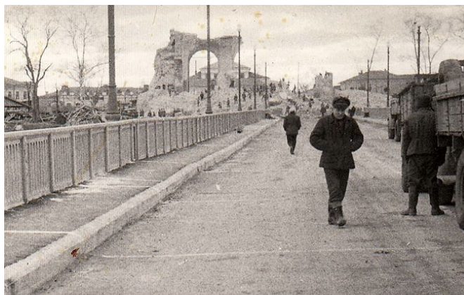
Разрушенный Преображенский собор в городе Глазове. Май 1961 г.

Таким образом, тема православного Глазова 1879 года была раскрыта в произведениях Владимира Галактионовича Короленко с разной степенью достоверности и полноты. Если сведения о городских храмах и духовенстве в очерке «Ненстоящий город» и повести «Глушь» историку следует пользоваться с очень большой осторожностью и оговорками, то рассказ «Собор с зарокотом» содержит ценнейшую информацию буквально из первых рук.