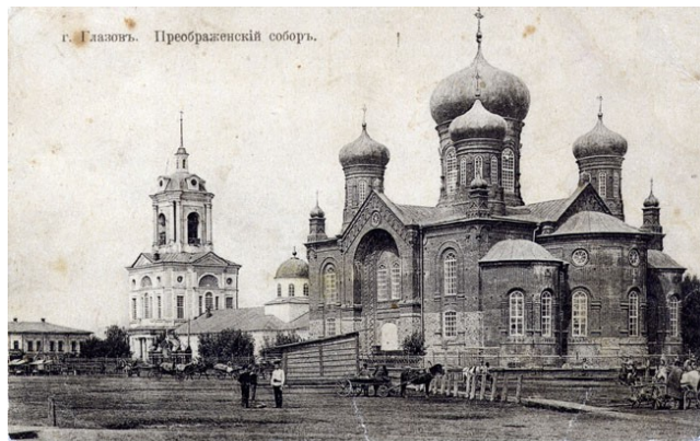
Глазов. Вознесенско-Преображенский собор. Начало XX в.