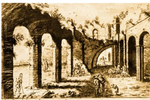
Рис. 2. Абрахам ван Вестерфельд. Собор св. Софии в Киеве. Интерьер южной наружной галереи. 1651 г.

Abraham van Westerveld (1620/1621–1692, Роттердам) – голландский художник, работал при дворе литовского гетмана Януша Радзивилла.