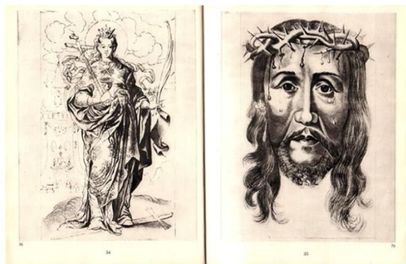
Жолтовський П.М. Навчальні малюнки учнів іконописної та малярської майстерні Києво-Печерської лаври Рисунки XVIII в.

печерских маляров» [17]. Излюбленным источником для лаврских художников был «Библейский театр» Николая Фишера в латинизированной форме Пискатора.