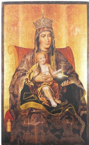
Икона Золотарев. Богоматерь с младенцем на престоле. Конец XVII в.

Из книги А.И. Успенского «Царские иконописцы и живописцы XVII» известно, что в 1681 г. иконописец Оружейной палаты Карп Золотарев – ученик Салтанова по государеву указу был прислан «описывать церковные чертежи» в Киев, Глухов и Батурин, Переяславль, Нежин, «в иные розные малороссийские города».