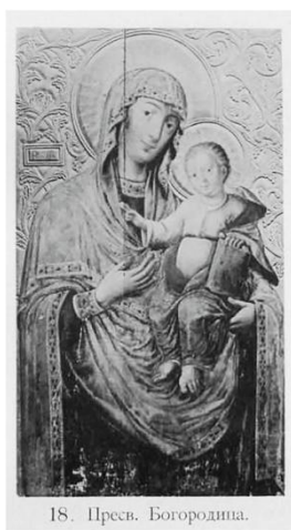
Пресвятая Богородица Из альбома выставки XII Археологического съезда (Харьков, 1902 г.)

Исходя из анализа политической ситуации в Малороссии в XVI–XVIII вв. неправомерно говорить о развитии в это время киевской живописи и привлечении польских или иноземных художников для росписи разрушенных православных храмов. В конце XVII–XVIII вв. Малороссия и Киев только оправлялись от ужасных разорений, учиненных польской шляхтой и католической церковью. С помощью русского государства на этой территории восстанавливалось православие, строились новые православные храмы, для их росписи отправлялись известные московские живописцы. На Слобожанщине в это же время уже процветало церковное искусство.