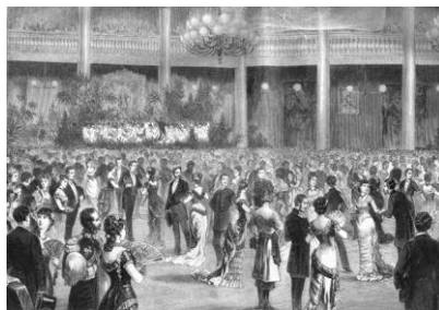
Билл. Гравюра из журнала «Всемирная иллюстрация»

(«пустоцвет не продержался и одного года»). Даже сама краткость научной жизни служила аргументом в борьбе с инакомыслящими и иноверцами. Именно поэтому ранний уход из научного сообщества (в качестве протеста или преждевременной смерти) интерпретировался как слабость или несчастье ученого. Считалось, что «подлинный» талант всегда пробьется, а если ученый не реализовался, то у него и не было на то дарований. В этой связи переход (даже конфликтный) профессора в другой университет и последующая успешная карьера рассматривались его конкурентами как умысел, образующий континуитет научной биографии (даже если ученый считал это трагическим разрывом в собственной судьбе).