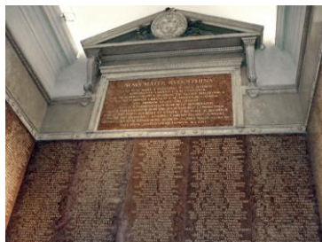
Имена почетных выпускников Венского университета.

разделяемые эффекты и через это – сознание и эмоции слушателей. Проговариванием корпоративного опыта спектакли, публичные защиты, выступления на заседаниях совета, лекции усиливали ключевые символы, что систематически утверждало связь между широким спектром разнообразных культурных элементов [56], т.е. являлось единым, разворачивающимся во времени и в пространстве рассказом-убеждением. В нем российский университет предстал как недавно привитый в России отросток, взятый от многовекового древа европейской культуры.