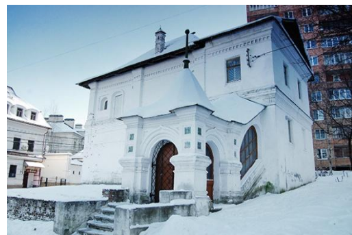
Нижний Новгород. Домик Петра I. 2014 г.

торцевой части здания с восточной стороны. Как появилась эта керамика на фасаде? Была ли она частью коллекции, собранной для первого городского музея Нижнего Новгорода во второй половине XIX в.? Какова ее дальнейшая судьба? Эти и другие вопросы определили направления исследовательской работы для данной статьи.