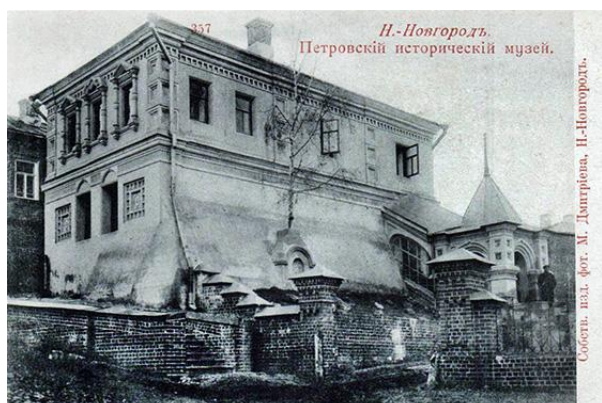
М.П. Дмитриев. Нижний Новгород. Петровский исторический музей. 1895 г.

Изучение керамического декора этого здания – непростая задача. Исторически сложилось так, что сегодня его детали находятся в разных местах, часть из них распределены по различным музейным хранилищам России. Информация собирается по крупицам, и для ее систематизации необходимо обратиться к истории музейного дела в нижегородском крае.