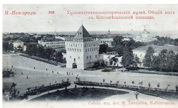
М.П. Дмитриев. Нижний Новгород. Художественно-исторический музей. Общий вид с Благовещенской площади. Нач. XX в.

Художественно-исторический музей в Нижнем Новгороде был открыт в 1896 г. в Дмитриевской башне Нижегородского кремля, он стал одним из первых общедоступных музеев в русской провинции [1]. Официальному открытию предшествовал долгий путь сбора средств и фондовых материалов, которые первоначально были размещены в «Домике Петра I» (сегодня ул. Почаинская, д. 27) в 1890 г. и представлены публике в 1895 г. Сегодня это здание – объект культурного наследия федерального значения. Оно имеет культурную и историко-архитектурную ценность.