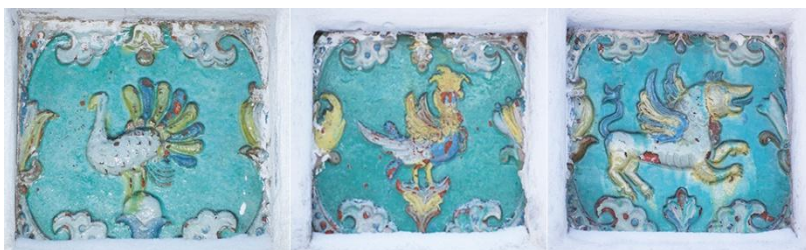
Изразцы на фасаде «Домика Петра I». 2022 г.