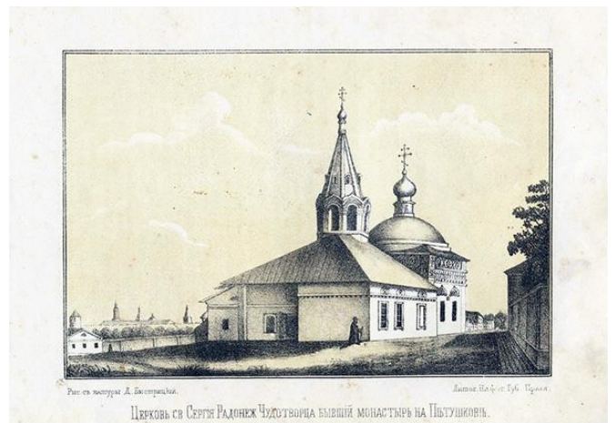
Д.Я.Быстрицкий. Нижний Новгород. Сергиевская церковь. XIX в.

Сергиевский храм – один из старейших в Започаинском районе Нижнего Новгорода. Деревянная Сергиевская церковь просуществовала до 1701 г. Затем она была перестроена в каменную [11]. В 1715 г. церковь пострадала в большом пожаре, была обновлена и, вероятно, тогда же на ее стены поместили архитектурные изразцы. В 1864-1865 гг. ветхий каменный храм был разобран, снятые с него изразцы попали к Л.В.Далю, как он и рассчитывал, о чем упоминалось выше. Его