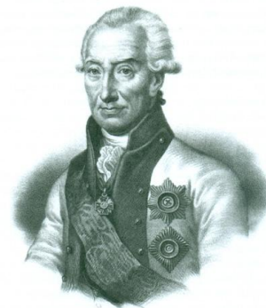
Василий Яковлевич ЧИЧАГОВ