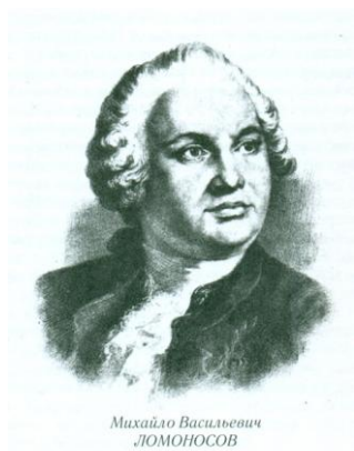
Михайло Васильевич ЛОМОНОСОВ

В течение многих лет Ломоносов упорно настаивал на посылке специальных научно-исследовательских экспедиций для нахождения Северного морского пути. М. В. Ломоносова. Основываясь на направлении течений, замеченных около острова Шпицбергена, на предполагаемом движении льдов и, Ломоносов полагал, что в июне месяце, между Шпицбергенем и Новой Землёй, океан очищается от льдов и что в широте 80° и в расстоянии от берегов Сибири около 600 вёрст открытое место тянется на восток, по крайней мере, на тысячу вёрст. Он был твёрдо убеждён, что по этому свободному от льдов пути легко можно пройти до Берингова пролива и оттуда в Ост-Индию.