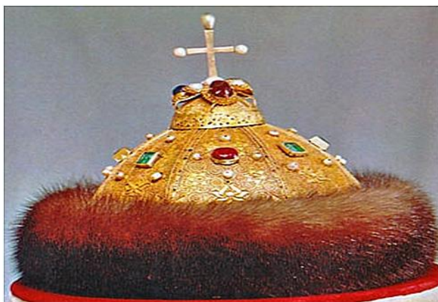
Шапка Мономаха. От Владимира Мономаха выводили свой род московские цари, поэтому великокняжеский венец, наряду со скипетром и державой, стал одним из главных атрибутов власти правителя всея Руси. Важным элементом церемонии восшествия на трон стало водружение на голову нового правителя шапки Мономаха. Этот обряд называли «венчанием на царство».

Владимир Мономах в своих поучениях оставил в наследство руководителям Российского государства два завета: 1) «Ибо не хочу я зла, но добра хочу братии и Русской земле» [7]; 2) «Прочитав эту грамотку, постарайтесь на всякие добрые дела, слава бога со святыми. Смерти ведь, дети, не боясь, ни войны, ни зверя, дело исполняйте мужское, как вам бог пошлет» [8]. И, как показывает отечественная история, руководители Российского государства, кто лучше – кто хуже, следовали этим заветам.