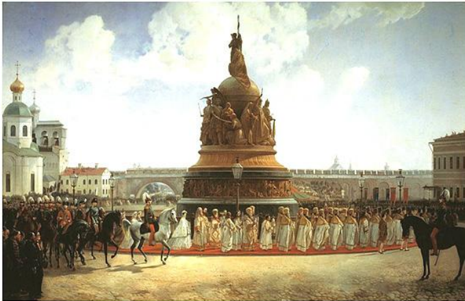
Художник Б.П. Виллевальде Открытие памятника «Тысячелетие России» в Новгороде в 1862 году 1864 г.

Задуманный как историческая летопись в лицах, как воплощение ценностной иерархии русской истории, как пантеон национальных героев, монумент представлял собой трехъярусную многофигурную композицию.