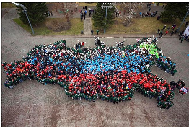
Из Преамбулы Конституции Российской Федерации: «Мы, многонациональный народ Российской Федерации...»

Перед началом Куликовской битвы из уст Дмитрия Донского прозвучало обращение к воинам – сыны русские . Через два столетия, в эпоху Смуты, в литературе утвердилось выражение – доброхоты земли русской . Широко употребляемое ныне и привычное для слуха слово патриот, появившись в 1716 году в «Рассуждениях о причинах Свейской войны» П.П. Шафирова, вплоть до конца XIX века использовалось параллельно со своим синонимом – русским термином сын Отечества [4].