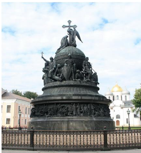
Памятник «Тысячелетие России» в Великом Новгороде. Скульпторы М.О. Микешин, И.Н. Шредер и архитектор В.А. Гартман. Открыт 8 сентября 1862 года. В конце XIX века этот памятник называли «сокращенным курсом русской истории».

8 сентября 1862 года, в день торжественного открытия памятника «Тысячелетие России», на приеме дворян Новгородской губернии император Александр II произнес юбилейную речь, содержащую программные положения своей деятельности на благо России: «Поздравляю Вас,