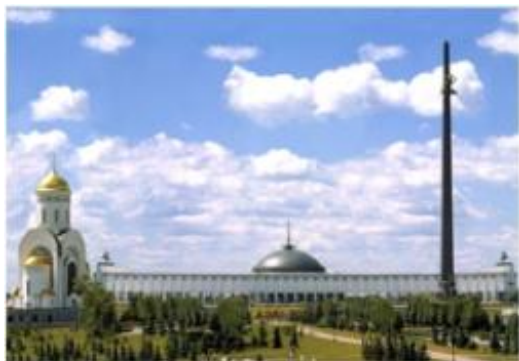
Мемориальный комплекс Победы в Великой Отечественной войне 1941–1945 годов на Поклонной горе в Москве

Впервые Поклонная гора упоминается в документах XVI века. В то время ее называли немного иначе – Поклонная гора на Смоленской дороге. Именно на Поклонной горе Наполеон в 1812 году тщетно дожидался ключей от Москвы, через нее же в годы Великой Отечественной войны шли на фронт солдаты защищать Родину.