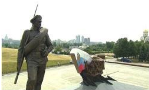
Памятник «Героям Первой мировой войны» в Москве

1 августа 2014 года, к 100-летию начала Первой мировой войны, на Поклонной горе в городе Москве открыт памятник «Героям Первой мировой войны» (инициатор возведения монумента – Российское военно-историческое общество; авторы памятника – скульпторы А. Ковальчук, П. Любимов, В. Юсупов, архитекторы М. Корси, С. Шленкина).