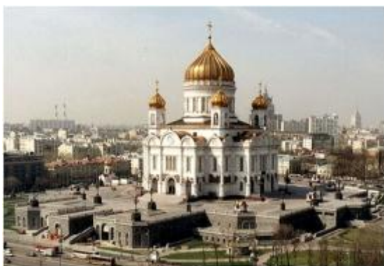
Храм Христа Спасителя в Москве

Отечественная война 1812 года и Храм Христа Спасителя. Храм Христа Спасителя был построен в благодарность за заступничество Всевышнего в критический период истории России как памятник мужеству русского народа в борьбе с наполеоновским нашествием 1812 года. По существу, Храм Христа Спасителя – воплощенная в камне благодарная молитва за чудесное избавление от неприятеля.