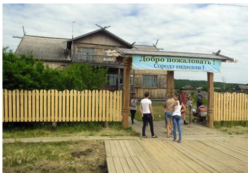
«Ульчская деревня», музей под открытым небом. Входная группа.

Одним из таких колоритных комплексов является село Булава («гора» - в пер. с ульчского), расположенное в Ульчском районе. Село находится в 757 км от г. Хабаровска и имеет статус национального. Развилось оно из родового стойбища в нач. XIX в., сейчас его населяют ульчи, нанайцы и русские с численностью чуть менее 2000 чел. Традиционными мужскими занятиями были рыболовство и охотничий промысел. Женщины собирали ягоды, корни, дикорастущие травы. Хозяйственная утварь и посуда изготавливалась из подручных материалов - из корней и побегов тальника, из бересты. Обувь и одежда делалась из рыбьей кожи, камуса и ровдуги (выделанная и спиленная оленья кожа), богато украшалась орнаментом, расшивались ковры. Производимые изделия имели несомненную ценность и передавались по наследству. На местном наречии они назывались «дяка» (богатство, драгоценность). В XX в. эти изделия обрели музейную ценность.