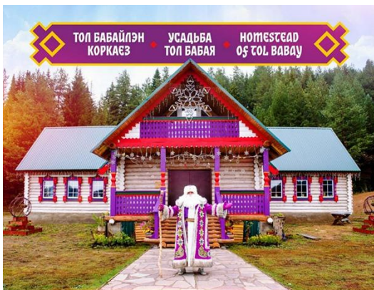
Культурно-туристический центр «Усадьба Тол Бабая»

снегоходов, мангалов, круглый год отмечают русские и удмуртские календарные народные праздники, финно-угорские мероприятия.