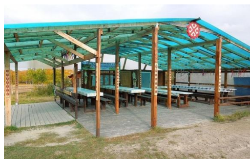
Этнографический центр «Силава»

На сайте центра указано, что «...миссией некоммерческой организации Общины коренных малочисленных народов Севера «Элы Хотал» является возрождение истории, культуры, народных промыслов и ремёсел кондинских манси» . «Эла Хотал» в переводе с мансийского означает «Будущее». Община КМНС основана 28 февраля 2008 г. и расположена на живописном берегу р. Конды в 14 км от г. Урая на месте бывшей мансийской деревни Новая Силава.