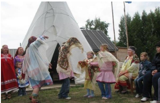
Этнографический центр «Силава». Демонстрация национальных танцев

Для России в целом остаётся актуальной проблема развития народов Севера. А.В. Назаров, бывший на посту губернатора Чукотского автономного округа в 1991 – 2000 гг., и «получивший» регион в 1991 г. в своей статье «Проблемы развития народов Севера» указывает на сложную социально-экономическую обстановку, связанную с ослаблением государственного регулирования, на продолжение ухудшения социального положения народов Севера. В качестве примера он указывает на высокую стоимость авиа - и других перевозок, вследствие чего 60% производимой продукции не доставляется в места её реализации вовремя или приходит в негодность. Также происходит сокращение поголовья оленей, уменьшение добычи рыбы, пушнины и морского зверя, сокращение сбора грибов, ягод, орехов, лекарственных растений и водорослей, практически свернуто медицинское, культурное, торговое и бытовое обслуживание оленеводов, рыбаков и охотников. Приостановлено строительство жилья, утрачиваются самобытные виды традиционного народного творчества. Все эти процессы не способствуют улучшению жизни коренных малочисленных народов Севера. Сохранение, возрождение и дальнейшее развитие этнического разнообразия, исследование самобытных и уникальных культур, как важнейшей части общечеловеческой культуры необходимо проводить на современном уровне, «без отрыва» населения от привычного образа жизни. В северных регионах необходимо создавать комплексы объектов производственной и социальной инфраструктуры,