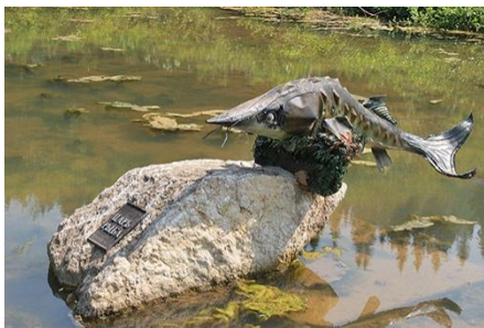
Этнографический парк «Истории реки Чусовой». Рыбка – оберег на берегу пруда

Для «погружения» в атмосферу крестьянских будней для туристов развели гусей – днём они находятся на территории. Для посетителей действует прокат костюмов – сотрудники предлагают фотосессии, например, в имеющейся в музее пожарной части. На реке Архиповка сделана маленькая мельница, внутри домика сооружён механизм. Берег реки представляет собой рекреационную зону, также недалеко расположен пруд. По рассказу экскурсовода, берег пруда