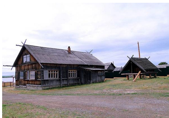
«Ульчская деревня», музей под открытым небом.

Также интересны для туристов этнографический музей под открытым небом, этнокультурный центр «Солнце» в селе Гвасюги (район им. Лазо) - национальное удэгейское поселение. Здесь проводятся выступления национального ансамбля