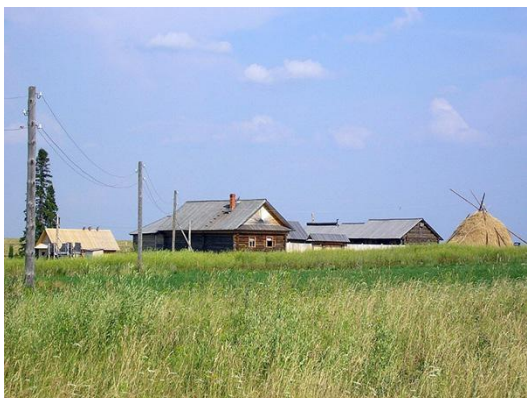
Историко-этнографический музей, деревня Лудорвай

впечатления, которые «ожидали намного больше». Связывают это люди очевидно с недостатком финансирования. Отмечают недостаточную организованность инфраструктуры и недостаточную оборудованность территории, отсутствие четкого и понятного для посетителей плана расположения экспозиции, большое количество закрытых объектов. По некоторым отзывам впечатление хуже, чем в «Центре Удмуртской культуры» в д. Карамас – Пельга. Отмечают, что на территории республики имеется масса туристических и просто деревень, где все это представлено гораздо более интересно. Бедность, «лубковость» экспозиции, несоответствие между площадью и количеством экспонатов, несогласованность работы служб – у людей возникали проблемы при организации индивидуальных и групповых экскурсий. Больше предпочтение отдаётся групповым посетителям. Плохая транспортная доступность и отсутствие необходимой инфраструктуры, минимального набора услуг, используемого в нашей стране, дополняют картину. Расстояние между центром Ижевска и деревней Лудорвай составляет приблизительно 12 км. Ввиду отсутствия регулярного автобусного сообщения непосредственно с музеем, добраться можно либо личным транспортом, либо пригородным автобусом Ижевск - Лудорвай, далее пешком, либо на попутном транспорте порядка 2-х км.