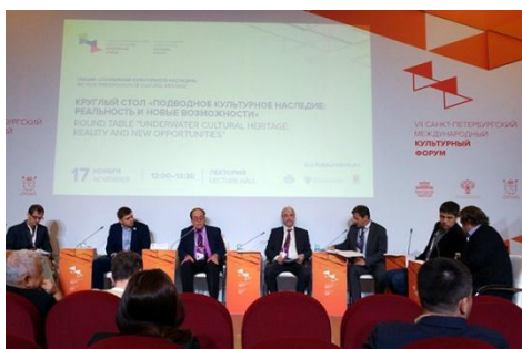
Круглый стол «Подводное культурное наследие: реальность и новые возможности»