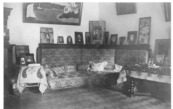
Интерьер диванной комнаты на втором этаже Большого дома.

В центральной части, расположенной в бывшем зимнем саду, перекрытом двускатной стеклянной кровлей, планируется создать метафорический образ Хозяйки оранжереи как яркой представительницы Серебряного века с его ориентирами на идею «Вечной женственности» и «Прекрасной дамы» в контексте флореальных образов модерна. Условное название раздела – «Прекрасная дама в платье Оранж» . Основной метод – музейно-образный [20], позволяющий создать экспозиционно-художественный «портрет» З.Г.Морозовой-Рейнбот на фоне ключевых флореальных символов «Зимнего сада».