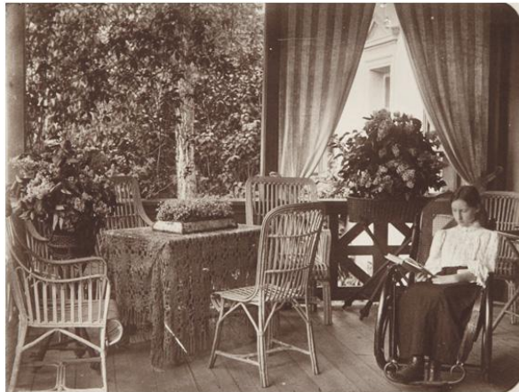
Портрет неизвестной из альбома фотографий «Виды имения Горки Московской губ.» семьи Герасимовых (?) 1900 е гг. (не позднее 1909).

Напомним, что Горки входят в число старейших усадеб Подмосковья и упоминаются в источниках с середины XVI столетия. Однако самую яркую страницу в истории имения открыла Зинаида Григорьевна Морозова-Рейнбот [5], купившая в 1909 г. обветшалую усадьбу у наследников директора правления Товарищества «Реутовская мануфактура» Г.С.Герасимова. Именно по ее заказу знаменитый русский зодчий Ф.О.Шехтель реконструировал главные здания с учетом новейших достижений и требований времени, и усадьба приобрела свой великолепный, современный вид. В настоящий момент Музей-усадьба «Горки» является смысловым центром и ключевым объектом Музея-заповедника «Горки Ленинские». И по красоте местоположения, и исключительной сохранности построек и интерьеров музей выступает одним из наиболее интересных памятников русской усадебной культуры.