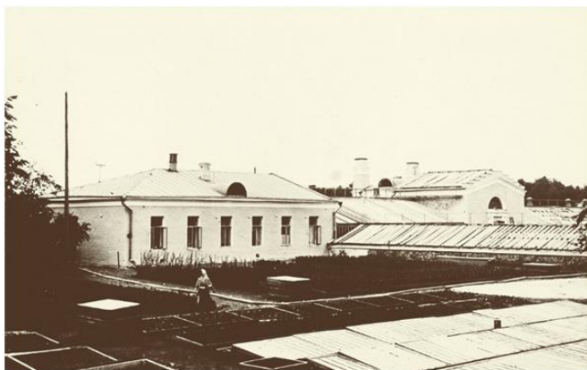
Оранжерейный комплекс в усадьбе Горки Автор: неизвестен. 1-я четв. XX в. (но не ранее 1909 г.).

В музейной практике сложилось два основных варианта включения подобных построек в экспозиционное и функциональное пространство музеев под открытым небом: