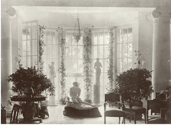
Зимний сад в парадной гостиной Большого дома усадьбы Горки.